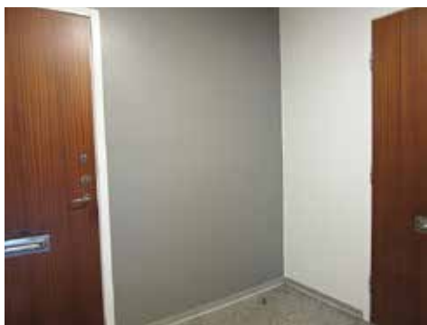
... och grå fondvägg på Porsvägen.