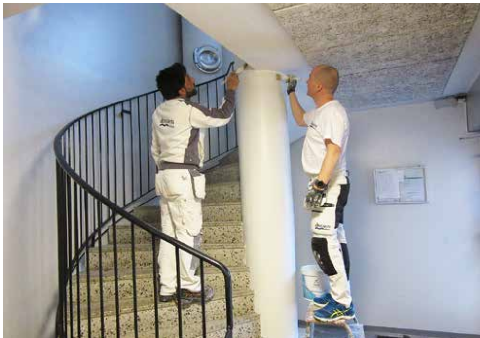
Målare färdigställer en av pelarna i porten på Åsgatan.